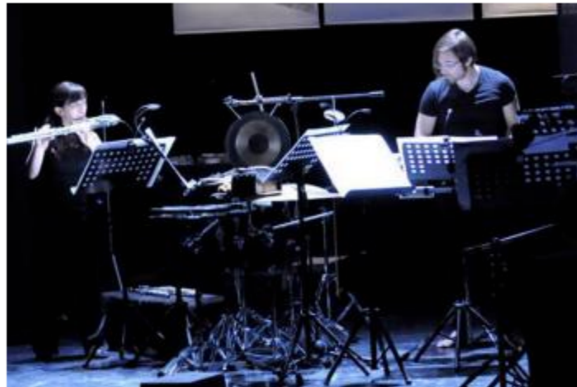
Grupo Hanatsu Miroir se presenta este viernes en la Ibero Puebla

Puebla, Pue.- La Alianza Francesa junto con la Universidad Iberoamericana ofrecerán un concierto musical contemporánea y performance este viernes 28 de marzo, que tendrá lugar en el lobby de la universidad a las 19:30 horas.