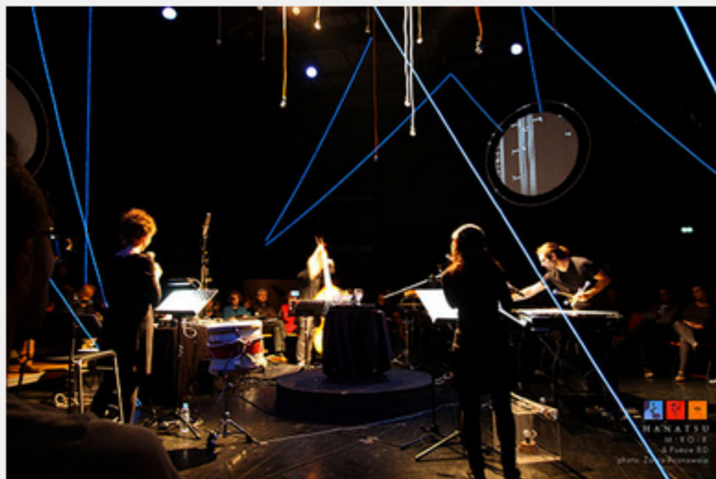
El grupo de música contemporánea Hanatsu Miroir nació en 2008 en Estrasburgo, Francia.

• Hanatsu Miroir reúne diferentes disciplinas artísticas en una puesta en escena